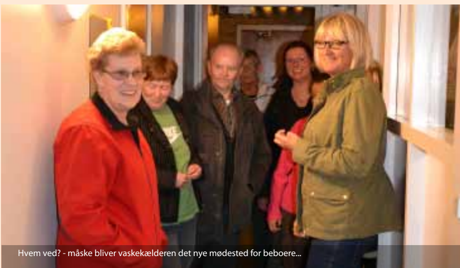
Hvem ved? - måske bliver vaskekælderen det nye mødested for beboere...

Selv om vaskeriet er topmoderne, har det ikke fungeret helt uden problemer fra starten. Beboere har berettet om problemer med adgang til vaskeriet og i forhold til betjening. Nortec har heldigvis været hurtige til at rykke ud, og problemerne skulle nu være løst.