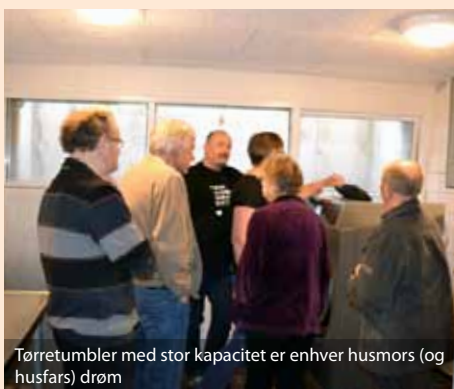
Tørretumbler med stor kapacitet er enhver husmors (og husfars) drøm

En beboer fortalte, at hun jævnligt benytter vaskekælderen: "Jeg synes, at det er så hyggeligt at komme herved og sludre med nogle af de andre beboere, og ellers trækker jeg en stol hen foran maskinen og løser kryds og tværs."