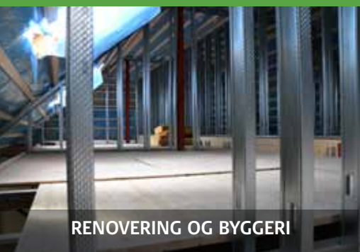
RENOVERING OG BYGGERI