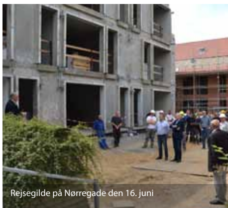
Rejsegilde på Nørregade den 16. juni

Håndværkerne spiller en central rolle i byggeriet lige nu. Boligselskabet Fruehøjgaard gør en ekstra indsats