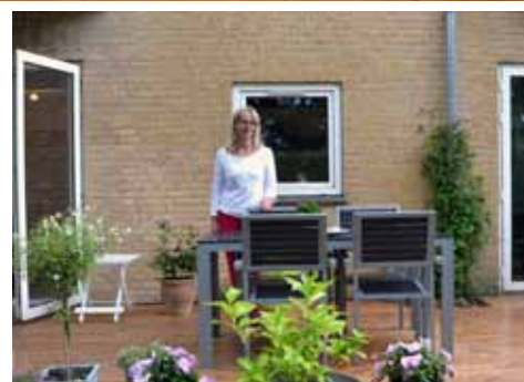
Helle på terrassen, som parret også har sat i stand efter, at de besluttede at blive boende.

"Vi blev ved med at sige: hvis bare vi kunne vælte den væg, så var vi fri for at flytte..."