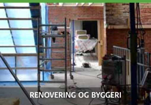
RENOVERING OG BYGGERI