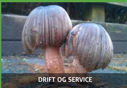
DRIFT OG SERVICE