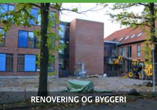
RENOVERING OG BYGGERI