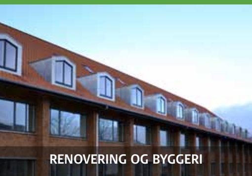
RENOVERING OG BYGGERI