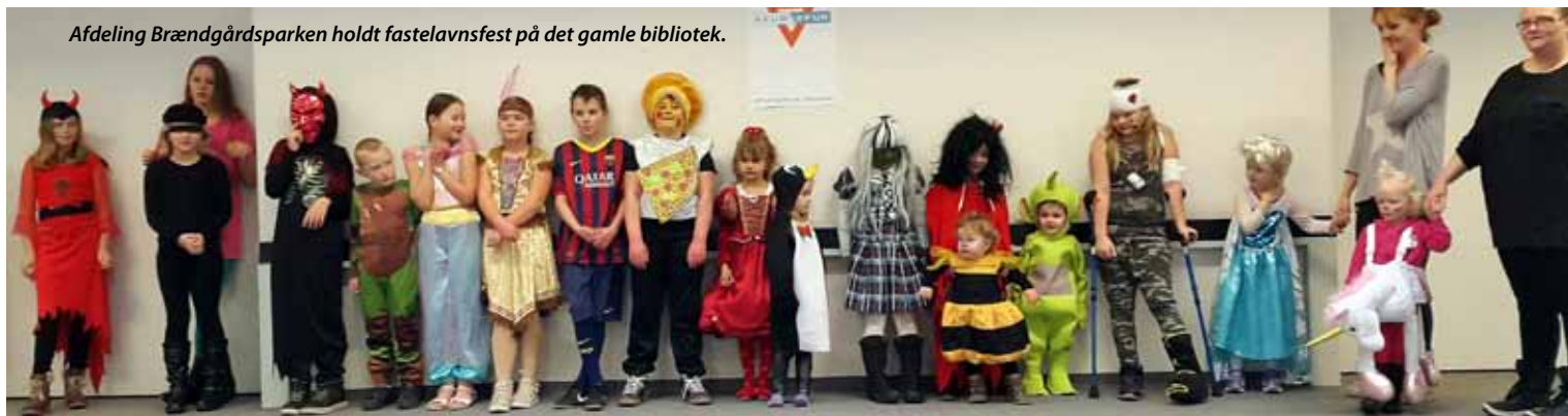
Afdeling Brændgårdsparken holdt fastelavnsfest på det gamle bibliotek.

Som det ses på billederne, er fastelavn stadig en festlig begivenhed, men det er nok mest børnene, der nyder det... og ikke mindst kattene, som ikke længere bliver brugt som fyld i tønden. Mon ikke også, at børnene er godt tilfredse med, at tønden i stedet er fyldt op med lækre sager. Både på Fruehøj og i Brændgårdsparken blev der slået katten af tønden i vinterferien. Se billederne her og på bagsiden af bladet.