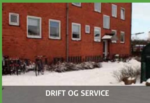
DRIFT OG SERVICE