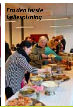
Fra den første fællesspisning