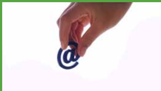
ADMINISTRATION OG DRIFT