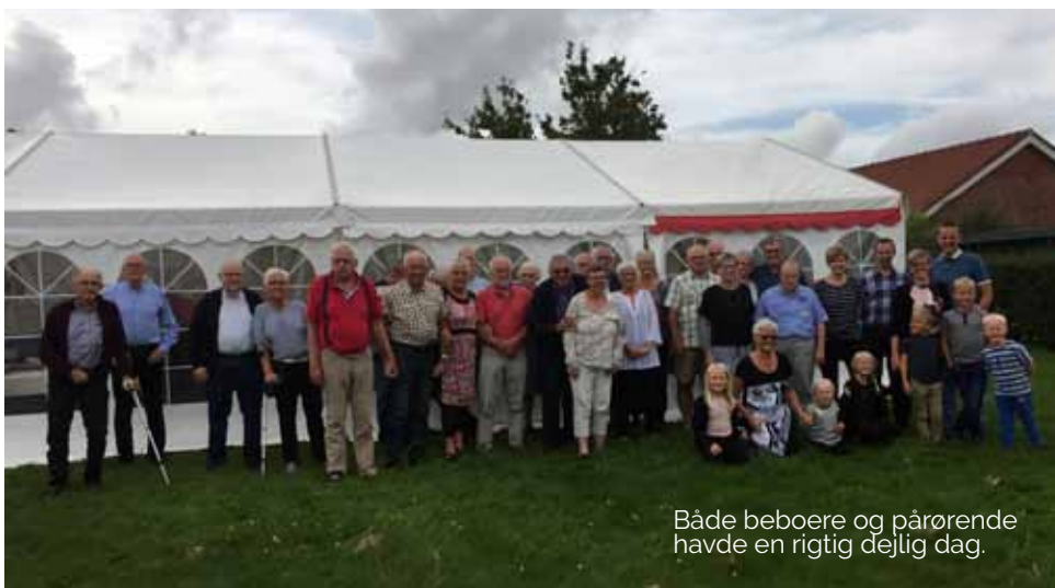
Både beboere og pårørende havde en rigtig dejlig dag.