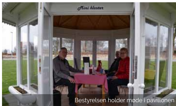
Bestyrelsen holder møde i pavillonen

Hvis det lykkedes afdelingen at rejse penge til en større pavillon, har de aktive frivillige planer om at åbne for blandt andet it-café, kreativ-café, kortklub og fællesspisning. Aktiviteterne vil være åbne for alle beboere i afdelingen samt ældre beboere fra lokalområdet.