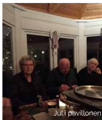
Jul i pavillonen