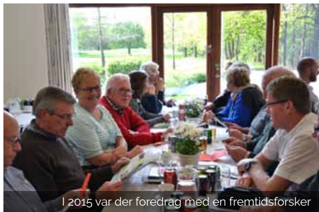
I 2015 var der foredrag med en fremtidsforsker