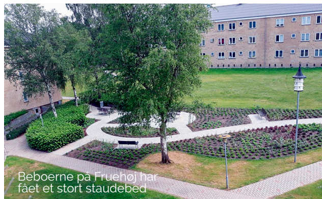
Beboerne på Fruehøj har fået et stort staudebed

Sidste år på afdelingsmødet i Storgården, besluttede beboerne, at man må have hund og kat i afdelingen