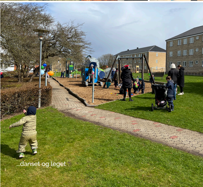
...dansen og leget