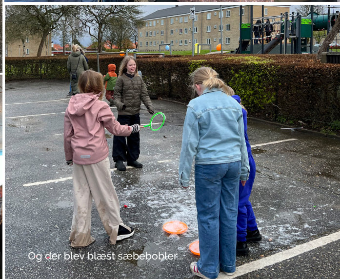
Og der blev blæst sæbebobler...