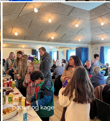
...pølser og kage