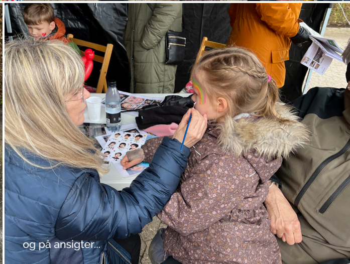
og på ansigter...