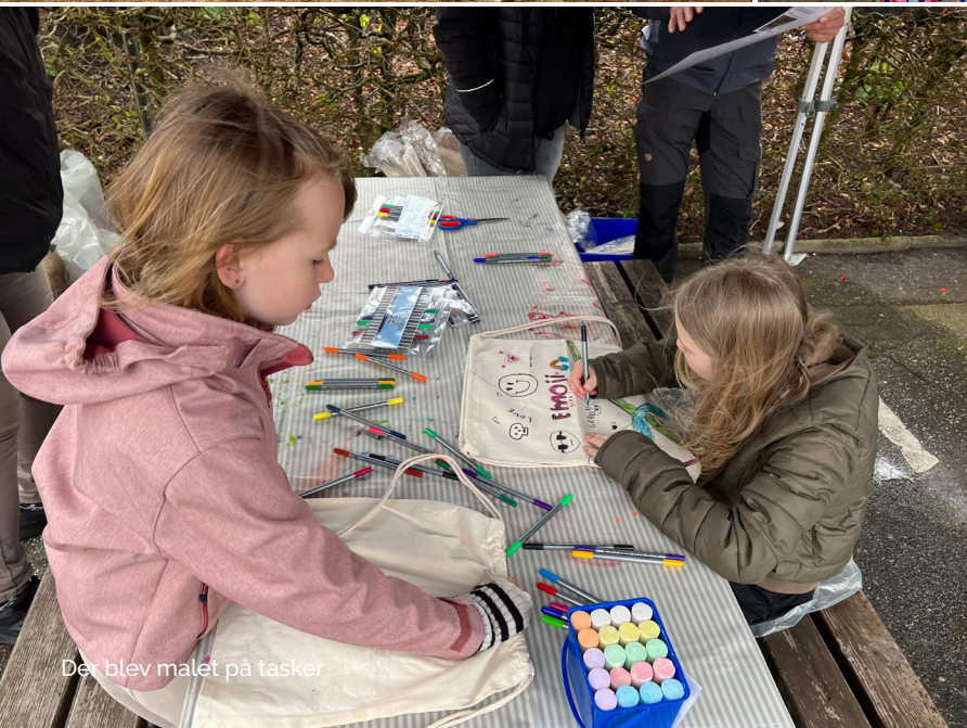
Der blev malet på tasker