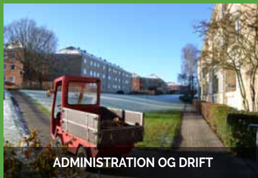
ADMINISTRATION OG DRIFT