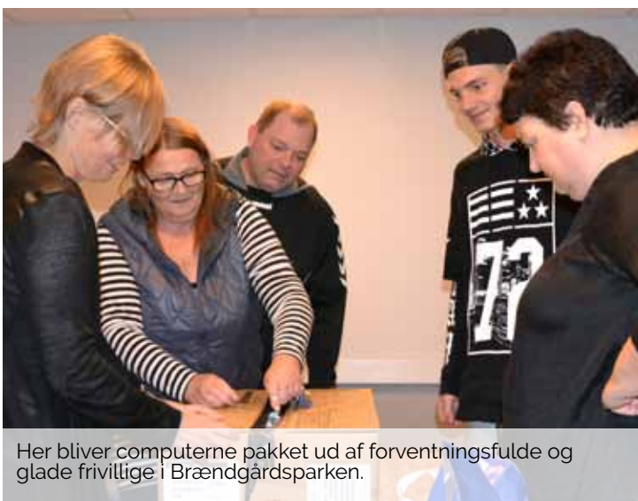
Her bliver computerne pakket ud af forventningsfulde og glade frivillige i Brændgårdsparken.

Det er muligt at tilmelde sig en papirversion for 25,- per opdatering. Synes du også, at I skal skifte til en digital beboermappe, så kan du foreslå det til din afdelingsbestyrelse.