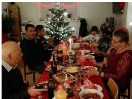
Børglumparken, december 2016

I Børglumparken var der fællesspisning juleaften. En somalisk kvinde og en syrisk familie oplevede en dansk jul. "Arrangementet har bidraget til en bedre kontakt til vores nye danskere i afdelingen", fortæller arrangørerne.