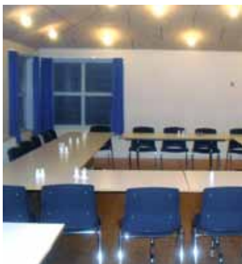
Næste fællesspisning på Fruehøj afholdes den 28. februar 2017