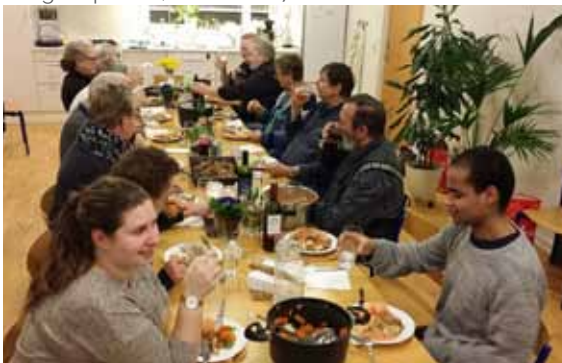
Børglumparken, februar 2017