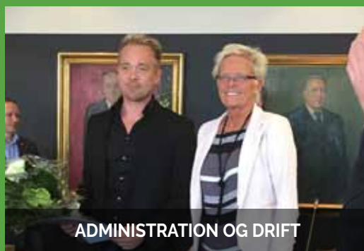
ADMINISTRATION OG DRIFT