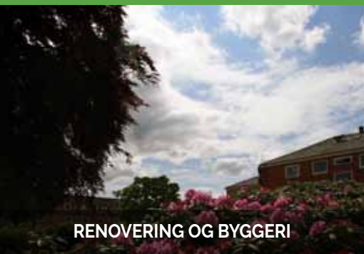
RENOVERING OG BYGGERI